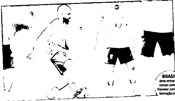
Lucas Paquetá comemora com o técnico Tite após a vitória contra o Equador com uma formação mista

Seleção Brasileira já está classificada, com a 1ª colocação da chave B; a Seleção Equatoriana é a 4ª colocada e ainda tem chances de classificação