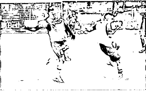
Equipe tricolor treina pensando no duelo contra o Botafogo, que pode valer uma vaga no G4 da Série B